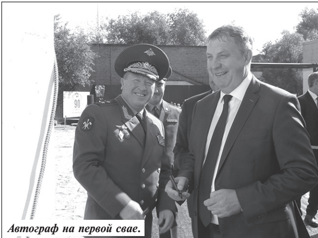
Автограф на первой свае.

Предприятие началось с небольшой металлообрабатывающей мастерской, организованной в Клинцах в 1928 году. В годы Великой Отечественной войны завод был преобразован в передвижную ремонтную базу, которая вслед за действующими войсками прошла до самой Германии. После Победы заводчанам в кратчайшие сроки удалось восстановить свое пред-